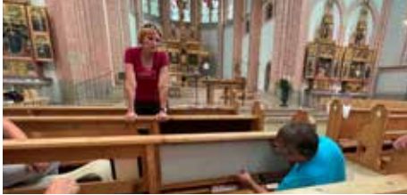
Die neuen Bankauflagen werden angepasst.